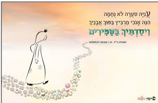
התמונה: מתוך ערכת גלויות הנחמה "עוד ניפגש" / פרשה ואשה

תנוחי. וכשאת נחה, גם הילדים יהיו בסדר; "וְכֹל בְּנֵיךָ לְמוֹדֵי ה' וְרַב שְׁלוֹם בְּנֵיךָ". אין כאן חס ושלום אצבע מאשימה למי שעבדה קשה מדי ("תראי, עכשיו תביני למה זה קרה לך"). הפנייה היא בכלל לא לאישה. הפנייה היא לסביבה של האישה. תזכרו שהיא עובדת קשה מאד-מאד. תזכרו לרפד אותה. אישה זה גוף, זה לא רק רוח, אפילו שבאמת אני מצדיעה לרוחן של הנשים של החצי שנה האחרונה. אבל זה עול לא פשוט בכלל. פיזית ונפשית.